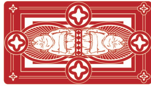
表 オリジナル (ご希望のデザイン)