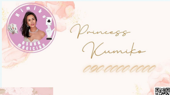
表 サンプルから選んでください。 20種類から選んでください。