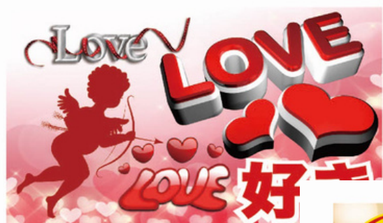
表 メッセージ 全5種類