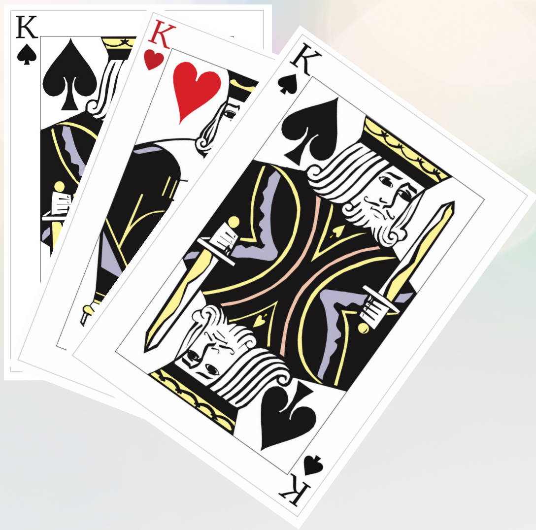
表 トランプの種類